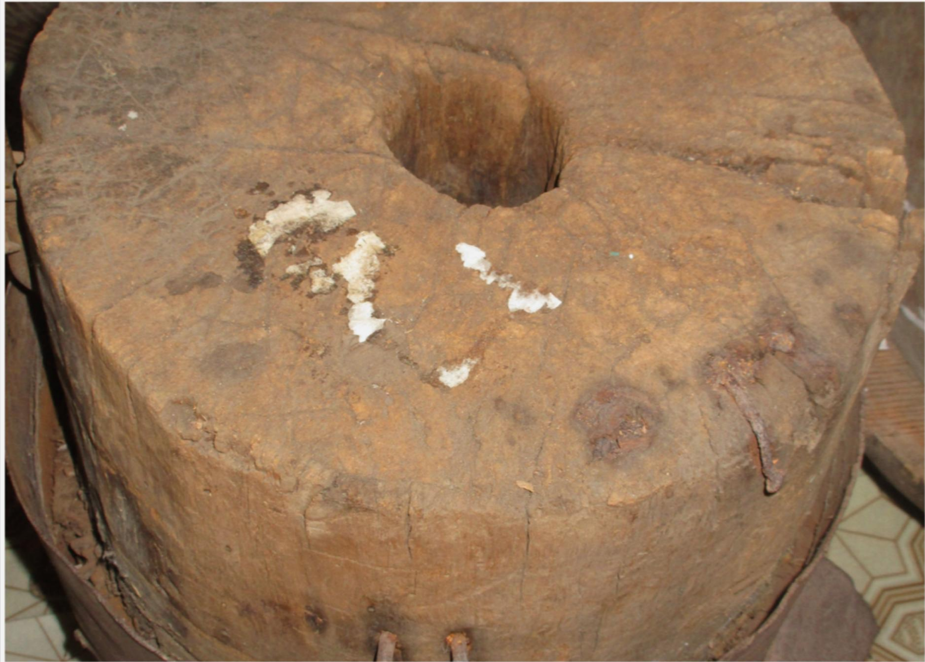
Мельница ручная – 40-50-е годы.