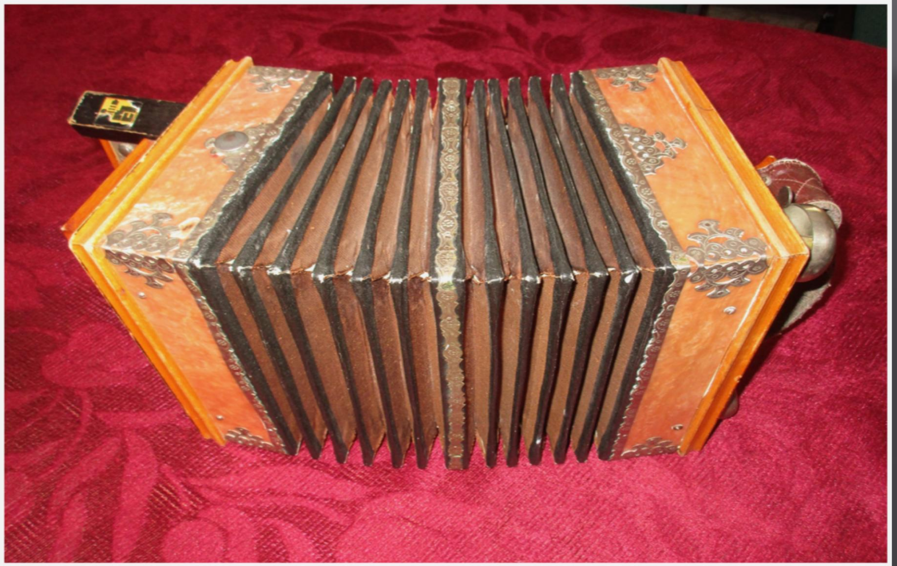
Гармонь саратовская с колокольчиками, 1967 г.