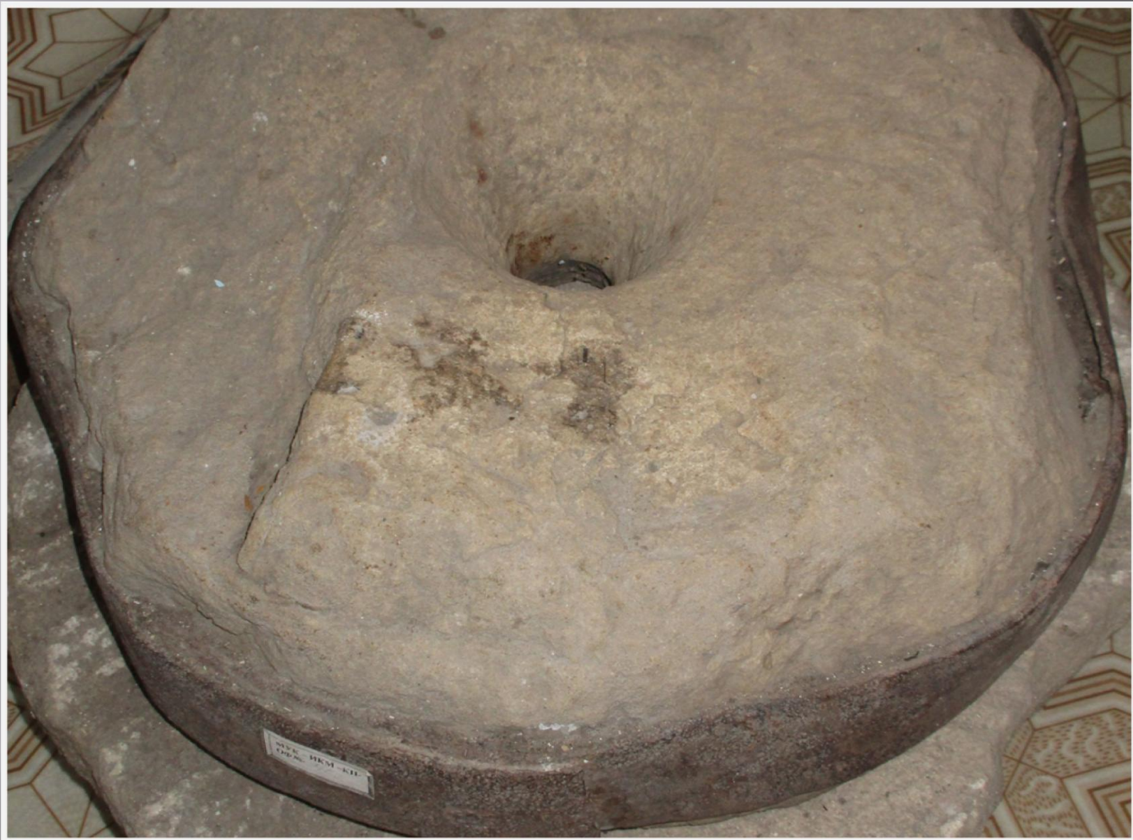
Жернова каменные – 50-60-е годы.