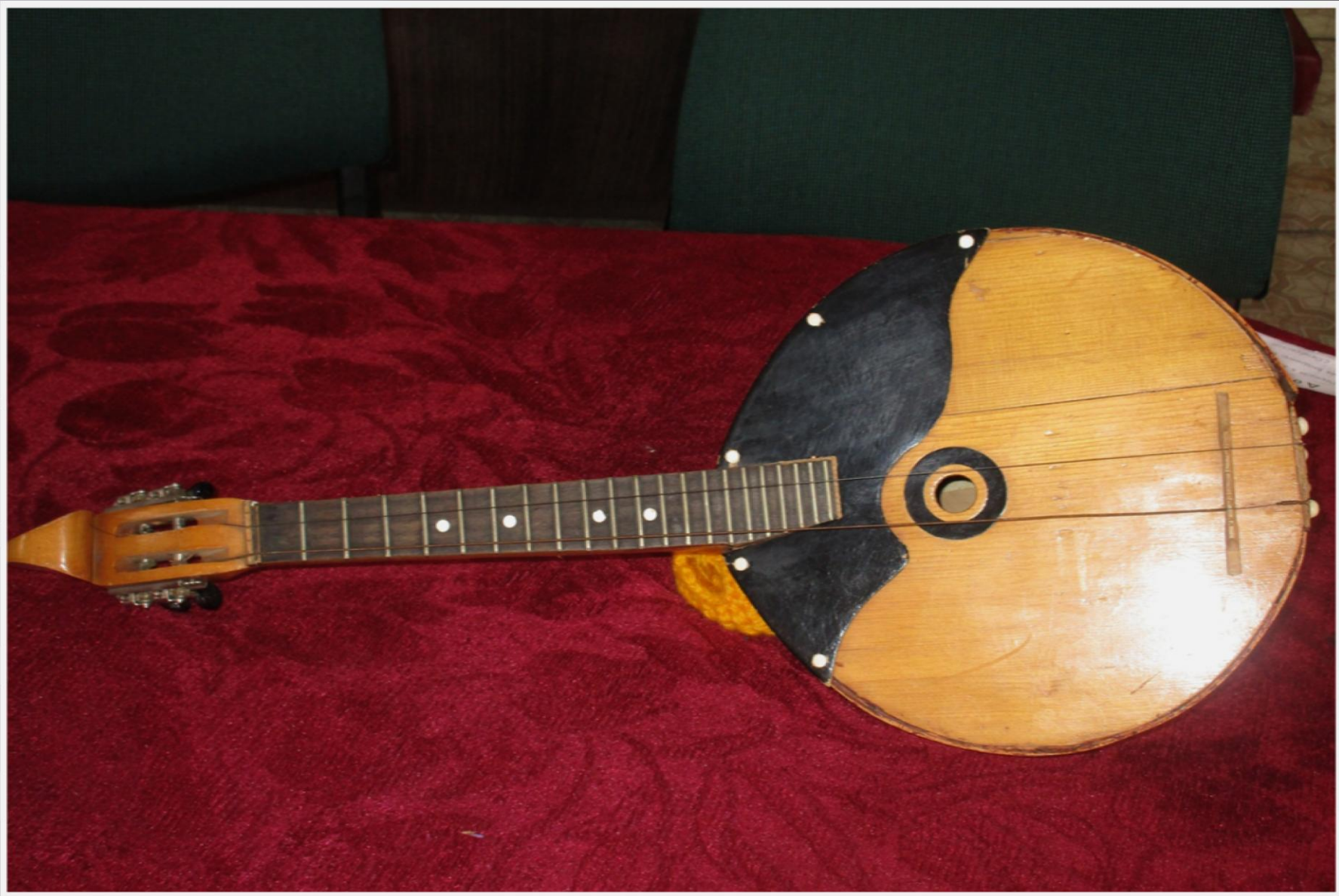
Домра, 1963 г.