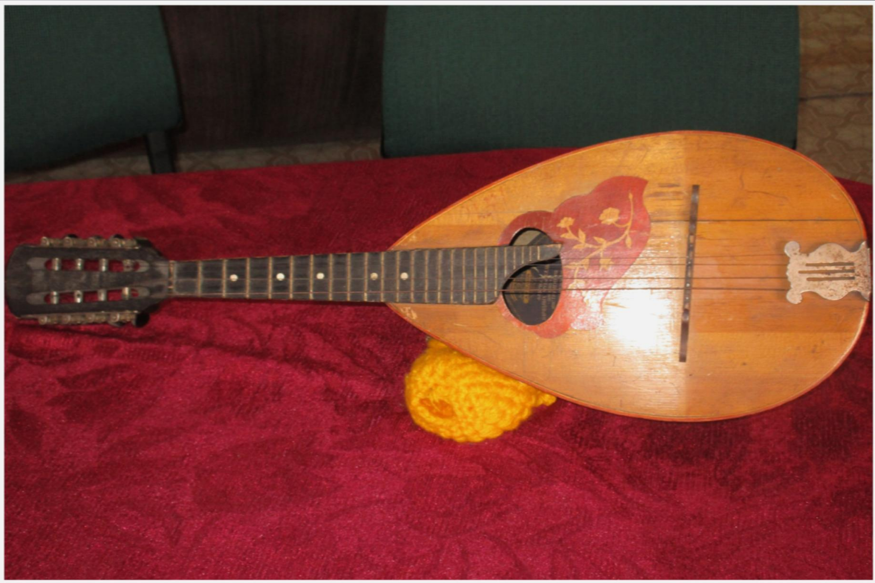
Мандолина, 1963 г.