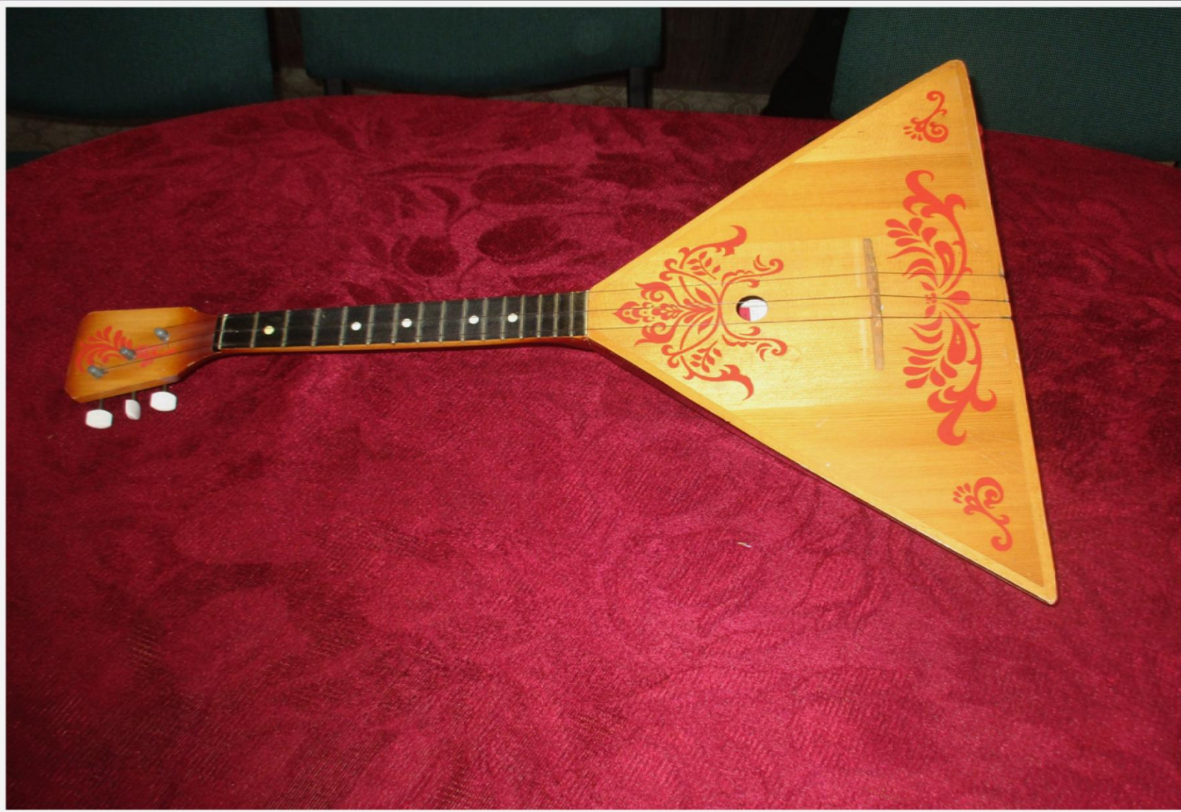
Балалайка, 1970 г.