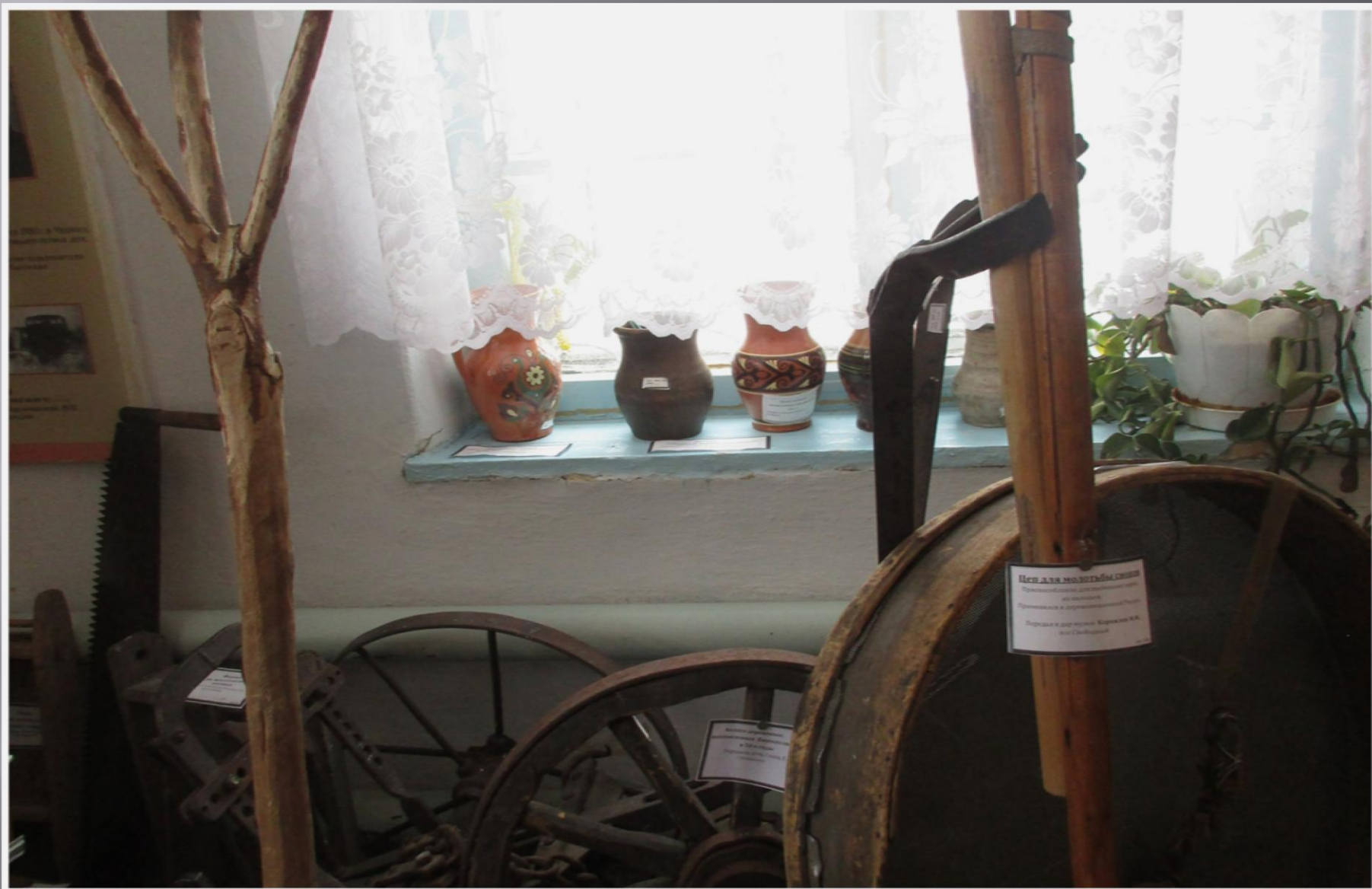
Деревянные вилы, однолемешный плуг, цеп, решето-грохот – орудие труда русского крестьянства- 50-е годы.