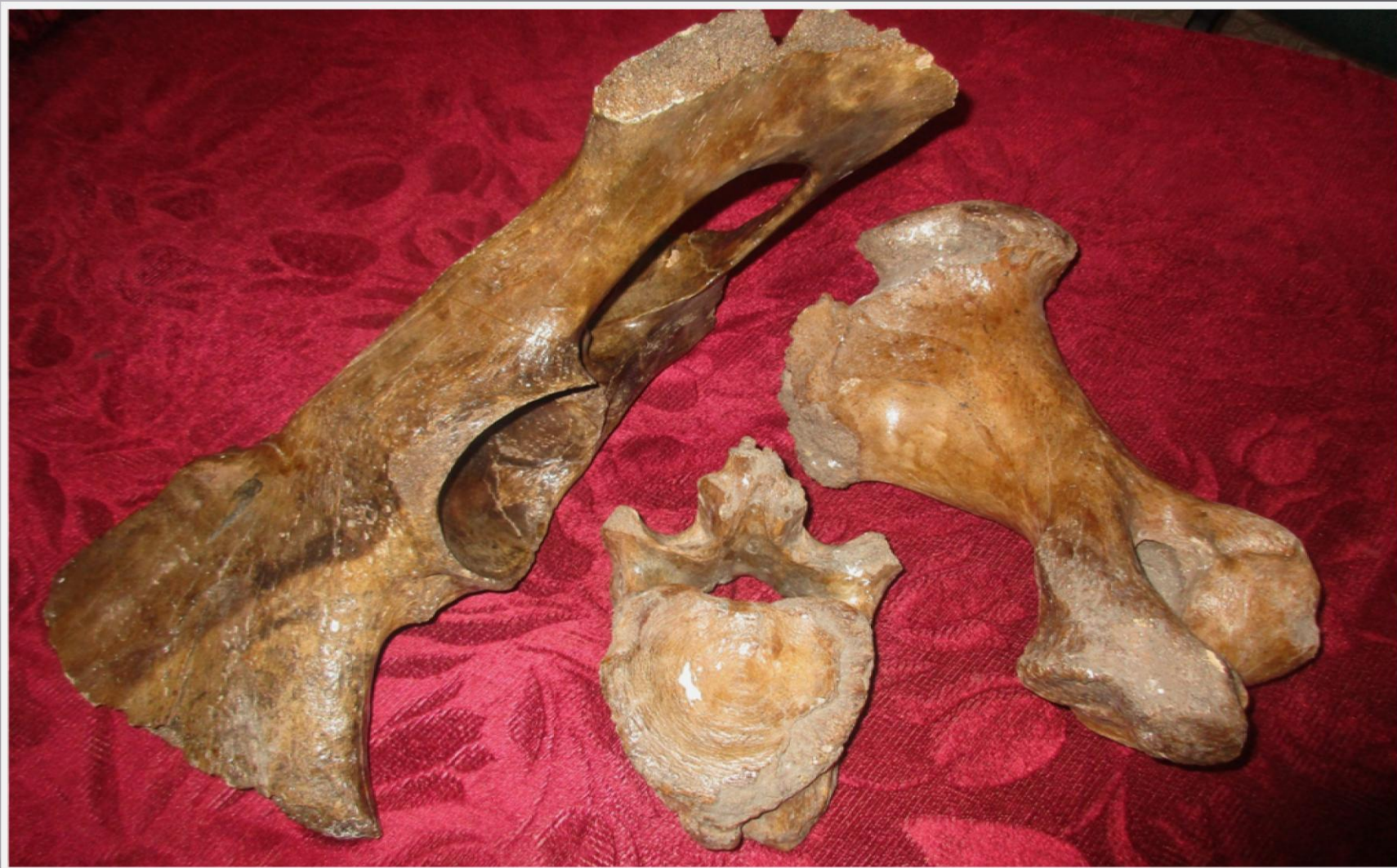
Позвонок, тазобедренные кости мамонта